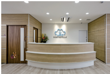
壁にシンボルキャラクターが描かれた受付